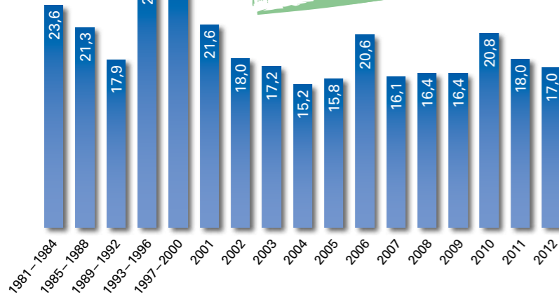
Entwicklung des Flächenverbrauchs in Bayern

17 Hektar pro Tag werden in Bayern für Verkehr und Siedlungsentwicklung verbraucht. Das entspricht ungefähr der Fläche von 24 Fußballfeldern.