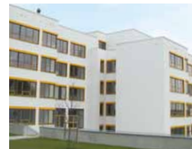
Realschule in Helmbrechts, Landkreis Hof

Bezeichnend ist, dass gerade auch die Auftraggeberseite sowie die Nutzer der Bildungseinrichtungen selbst von PPP überzeugt sind. Wie eine Studie des Instituts für Demoskopie Allensbach* zeigt, sehen 90% der Auftraggeber von PPP-Projekten im Schulbereich die Zusammenarbeit mit einem privatwirtschaftlichen Partner als positiv. Auch 62% der befragten Schulleiter und etwa ebenso viele Elternvertreter beurteilen PPP als vorteilhaft. Dabei wurden besonders die hohe Qualität der erbrachten Leistung, der geringe Verwaltungsaufwand sowie das gute Beschwerdemanagement hervorgehoben. Die Mehrheit der Auftraggeber und Nutzer ist davon überzeugt, dass der private Anbieter höhere Leistungen erbringt als dies bei einer herkömmlichen Umsetzung zu erwarten gewesen wäre.