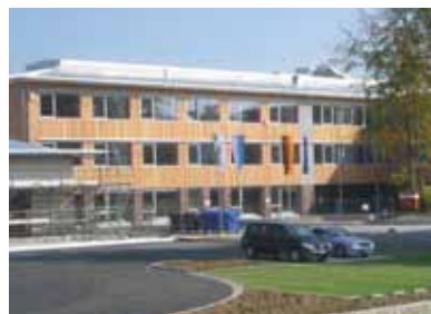
Gymnasium Kirchseeon, Landkreis Ebersberg

... Public Private Partnership (oder auch ÖPP, öffentlich private Partnerschaft) – die langfristige partnerschaftliche Zusammenarbeit von öffentlicher Hand und Privatunternehmen zur Realisierung von Infrastruktureinrichtungen, z.B. Verwaltungsgebäude, Sportanlagen, Kindergärten, Feuerwehrhäuser, Krankenhäuser, Kultureinrichtungen, Kläranlagen, Wasser- und Abwassernetze, Straßen oder besonders auch Schulen.