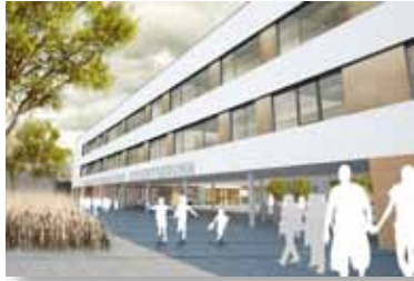
Gymnasium Höhenkirchen-Siegertsbrunn, Landkreis München