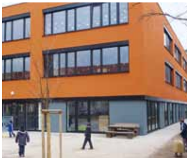
Kopernikus-Schule, Stadt Nürnberg

PPP – Public Private Partnership: Die Partnerschaft, in der Partner mehr schaffen.